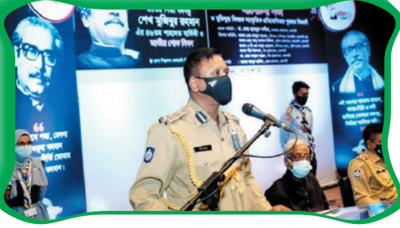
বঙ্গবন্ধু শেখ মুজিবুর রহমানের ৪৬তম শাহাদৎ বার্ষিকী ও জাতীয় শোক দিবস পালন