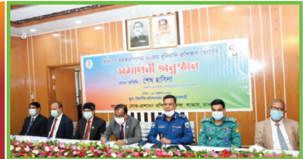
বিসিএস কর্মকর্তাদের ৭০তম বুনিয়াদি প্রশিক্ষণ কোর্সের সমাপতি অনুষ্ঠান