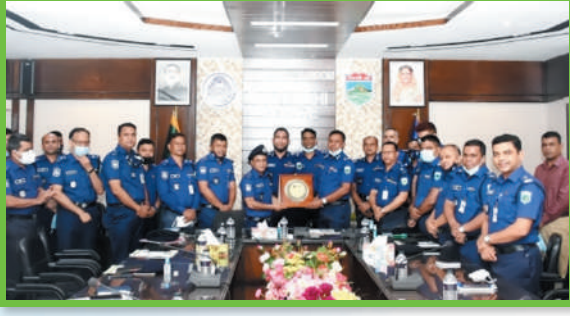
সাবেক পুলিশ সুপার বগুড়া মহোদয়ের বিদায় সংবর্ধনা