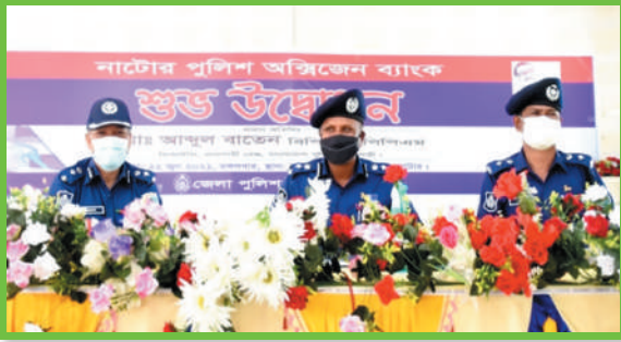
অস্বিজেন ব্যাংক উদ্বোধন, নাটোর