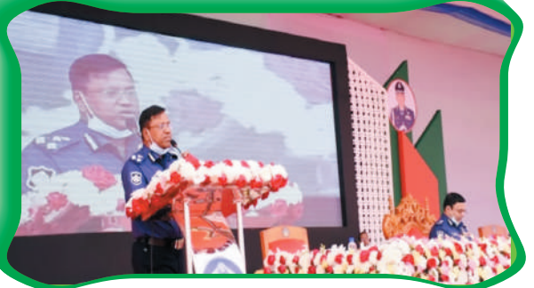
আইজিপি মহোদয়ের রাজশাহী রেঞ্জ সফর উপলক্ষ্যে বক্তব্য প্রদান