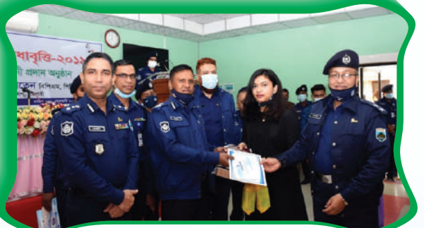
পুলিশ সদস্যদের সন্তানদের মেধাবৃত্তি-২০১৯ প্রদান