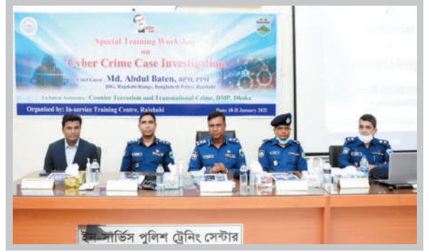
স্পেশাল ট্রেনিং ওয়ার্কশপ, ইন-সার্ভিস ট্রেনিং সেন্টার, রাজশাহী