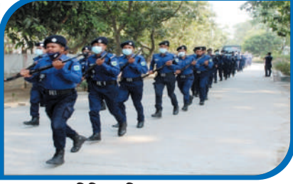
বিভিন্ন প্রশিক্ষণ প্রদান