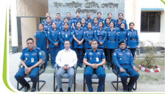
ছবি-৪: ই-ট্রাফিকিং কোর্স ছবি-৫: নারী ও শিশু সহায়তা কর্মকর্তাদের কোর্স