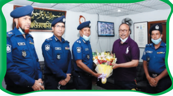
রাজশাহী সিটি মেয়র মহোদয়ের সহিত সৌজন্য সাক্ষাৎ