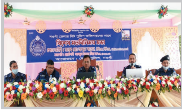
বিশেষ মতবিনিময় সভা-নওগাঁ