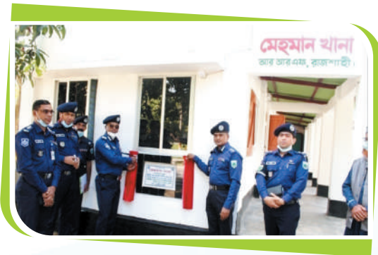
পুলিশ সদস্যদের জন্য মেহমান খানার শুভ উদ্বোধন