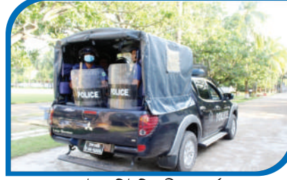
প্যাট্রোল ডিউটিকালীন সতর্ক থাকা

আরআরএফ, রাজশাহীর অফিসার ও ফোর্স রাজশাহী রেঞ্জের বিভিন্ন জেলায় আইন-শৃঙ্খলা নিয়ন্ত্রণে জেলা পুলিশকে সহায়তা করে থাকেন। এছাড়াও বাংলাদেশ পুলিশ একাডেমী, সারদা, তুলাক্ষেত ফায়ারিং বাট, সারদা, রাজশাহী, বাংলাদেশ ব্যাংক, বগুড়া এবং পাবনা জেলার ঈশ্বরদী থানাধীন ইপিজেড, রূপপুর পারমাণবিক বিদ্যুৎ কেন্দ্র, হার্ডিং ব্রিজ ও রিসোর্টের গার্ডে দায়িত্ব