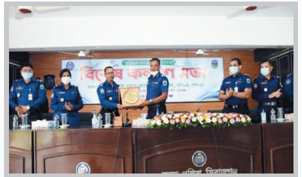
বিশেষ কল্যাণ সভা, সিরাজগঞ্জ