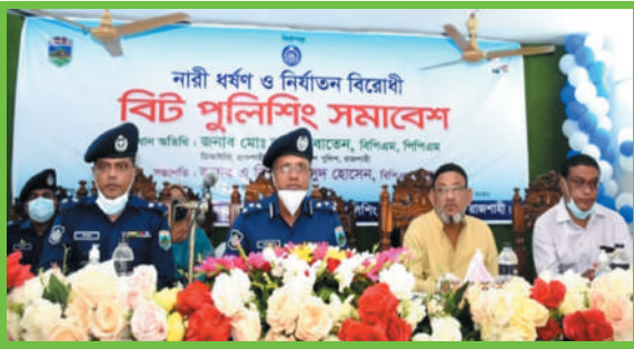
নারী ধর্ষণ ও নির্যাতন বিরোধী বিট পুলিশিং সমাবেশ