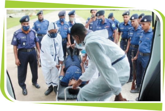
অসুস্থ পুলিশ সদস্যদের জরুরী সেবার ব্যবস্থা