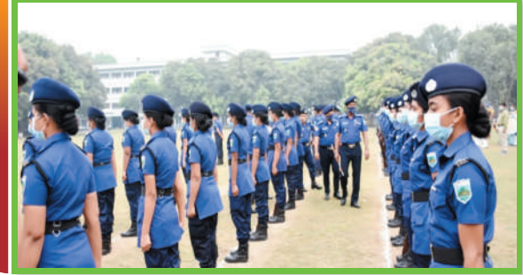
চাঁপাইনবাবগঞ্জ রিজার্ভ অফিস পরিদর্শন উপলক্ষে প্যারেড পরিদর্শন