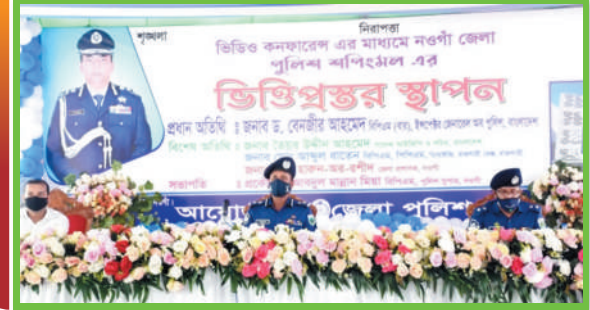
পুলিশ শপিংমেলের ভিত্তিপ্রস্তর স্থাপন অনুষ্ঠান, নওগাঁ