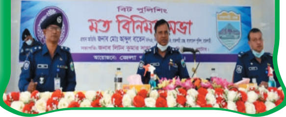
বিট পুলিশিং সমাবেশ-২০২০ নাটোর