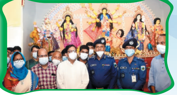
ডিআইজি মহোদয় কর্তৃক পূজা মন্ডপ পরিদর্শন, নাটোর