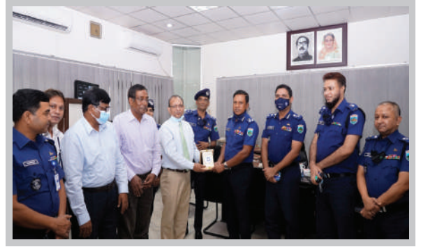
রাজশাহী বিশ্ববিদ্যালয়ের নব-নিযুক্ত উপাচার্যের সাথে ডিআইজি রাজশাহী রেঞ্জ মহোদয়ের সৌজন্য সাক্ষাত ও মতবিনিময়