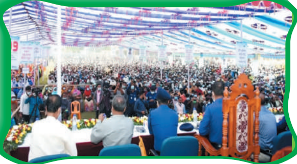
বিট পুলিশিং সমাবেশ-২০২০ বগুড়া