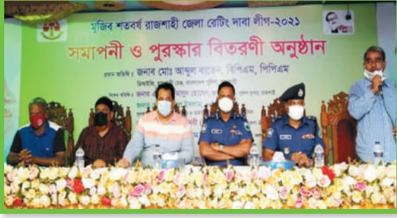
মুজিব শতবর্ষ উপলক্ষে রেটিং দাবা লীগের পুরস্কার বিতরণী-২০২১