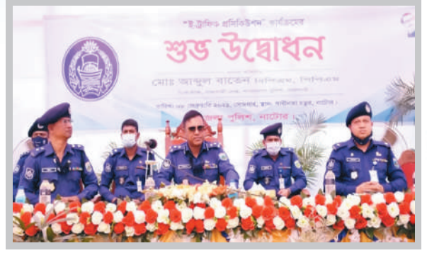
ই-ট্রাফিক প্রসিকিউশন কার্যক্রমের শুভ উদ্বোধন-নাটোর