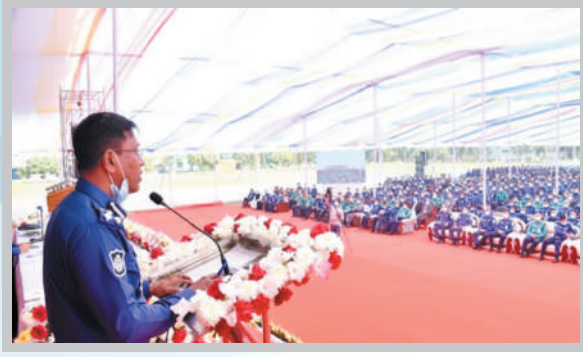
মাননীয় আইজিপি মহোদয়ের রাজশাহী রেঞ্জ সফর