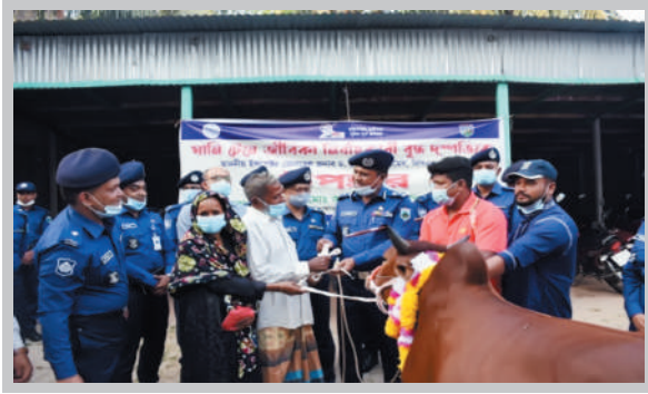
আইজিপি মহোদয়ের পক্ষে ডিআইজি মহোদয় কর্তৃক আর্থিক কষ্টে থাকা বৃদ্ধকে ১টি পশু উপহার