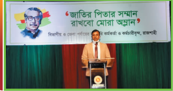
বঙ্গবন্ধুর ভাস্কর্য ভাংচুরের তীব্র প্রতীবাদ জানালেন ডিআইজি, রাজশাহী রেঞ্জসহ প্রজাতন্ত্রের কর্মকর্তাগণ