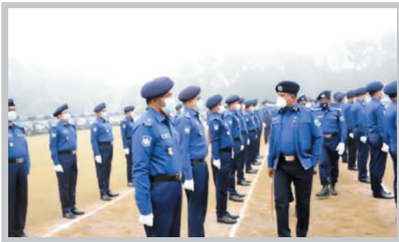
রাজশাহী জেলার রিজার্ভ অফিস পরিদর্শন উপলক্ষে প্যারেড পরিদর্শন