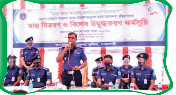
মাস্ক বিতরণ ও মাস্ক ব্যবহারে উদ্বুদ্ধকরণ কর্মসূচি